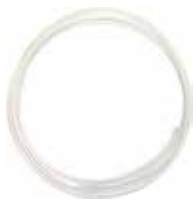
Junta: longitud 6,6 m para cortar a medida.